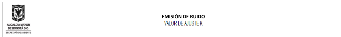
Tabla No. 7 Zona de emisión (Terraza predio receptor Carrera 87 No. 87 - 35 - Punto de monitoreo No. 1)